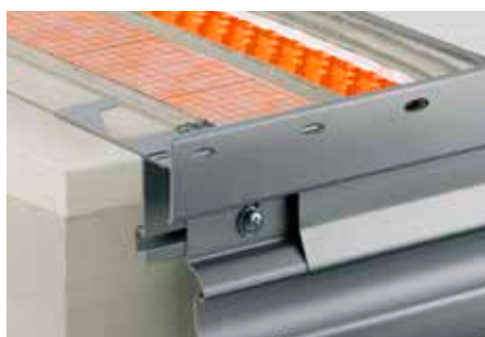
Konstrukcja z Schlüter®-DITRA-DRAIN 8 i Schlüter®-BARA-RTKE