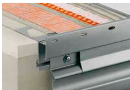
Konstrukcja z Schlüter®-DITRA-DRAIN 4 i Schlüter®-BARA-RTKE